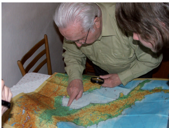
Gdzie ta Bolonia?..