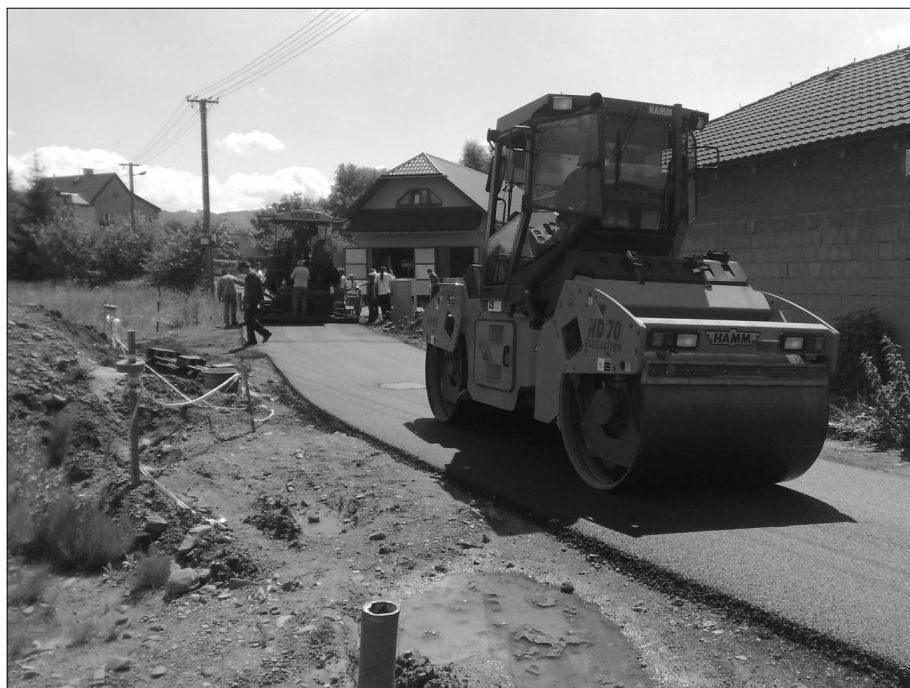
První vlašťovka, ostatní budou jistě následovat