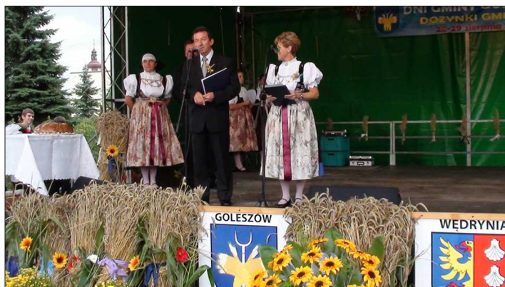
Dni Gminy Góleszów

Dne 31. 10. 2010 byl ukončen první ze dvou společných projektů, který byl spolufinancován z prostředků Fondu mikroprojektů Euroregionu Těšínské Slezsko – Śląsk Cieszyński Operačního programu přeshraniční spolupráce Česká republika – Polská republika 2007-2013, s názvem „Jdeme společně“ - amatérská umělecká tvorba odkazu epoch a národů. Tento projekt jsme společně organizovali s obcí Góleszów. Začal v březnu 2010 a byl ukončen 31. 10. 2010.