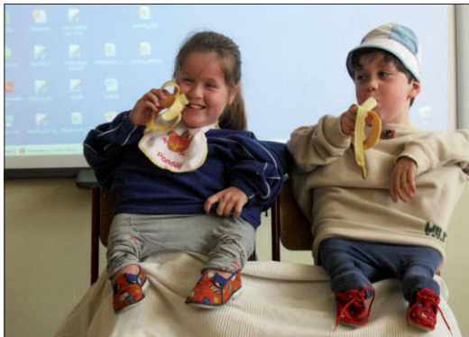
W śmiesznej scenie przedstawili się trzecioklasiści...

W poniedziałek, 29 marca, w naszej szkole obchodzono Dzień Nauczyciela. Na drugiej lekcji wszyscy uczniowie i grono pedagogiczne spotkali się w szkolnej stołówce. Tam wspólnie obejrzelśmy program każdej z klas. Programy były zrobione z myślą o nauczycielach.