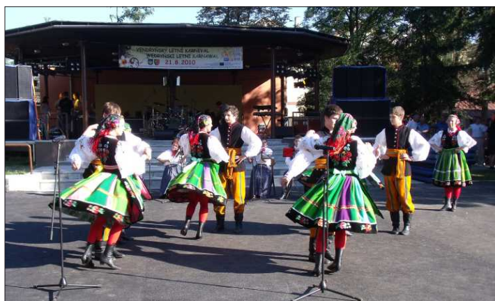
Vendryňský letní karneval