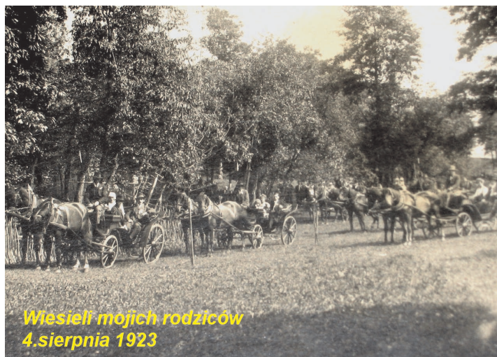
Wiesieli moich rodziców 4.sierpnia 1923

Když uvažujeme, kde jsou naše kořeny a jak se kdysi konaly svatby, napadla mě myšlenka kouknout do domácího fotoarchivu. Mám tam hodně černobílých fotek, které jsou z období od dvacátých let minulého století. Jedna z nich zachytila svatbu mých rodičů v roce 1923 v měsíci srpnu ve Vendryni.