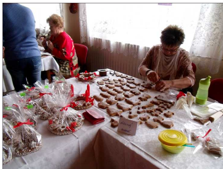
Dílny amatérské umělecké tvořivosti

Třetí akce pod názvem "Dni Gminy Góleszów" proběhla ve dnech 28. - 29. 8. 2010 v Góleszowie. Poslední akcí byly "Dílny amatérské umělecké tvořivosti a lidoví umělci". Uskutečnila se od 20. do 22. 10. 2010 v Czytelni. Na uměleckých dílnách byly k vidění různé techniky práce. Např.: malba na sklo pod vedením p. Szpyrca, paličkování, vyšívání, vazba ze suchých květů, výroba košíků, patchwork, zdobení perníků, výroba bižuterie, modely letadel a další. Po celé tři dny se zúčastňovaly dílen i lidoví umělci z Góleszowa (24 osob), kteří příznivě přispěli ke zdárnému průběhu celé akce. Celková účast na třídních dílnách byla kolem 700 - 800 lidí. Z toho k nám přijelo kolem 100 obyvatel z Polska.