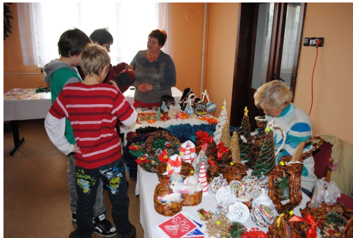
Umělecké dílny lidové tvořivosti

PROVÁDÍME třídění zeminy bagrem se speciální třídící lžičkou a možností terénních úprav.