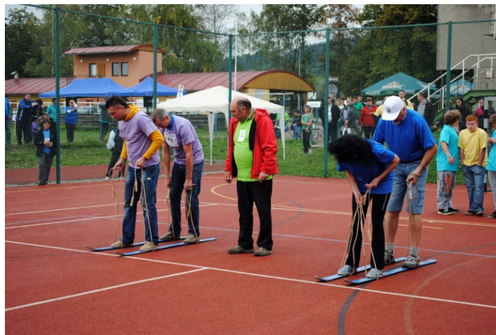
Olympiáda partnerských obcí

Je nutno podotknout, že projekt „Jdeme společně trochu dál – systémová spolupráce partnerských obcí Golezowa