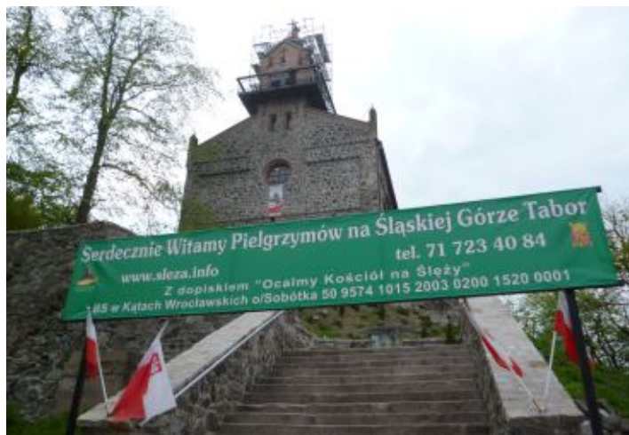
Kaple s uvítacím transparentem.