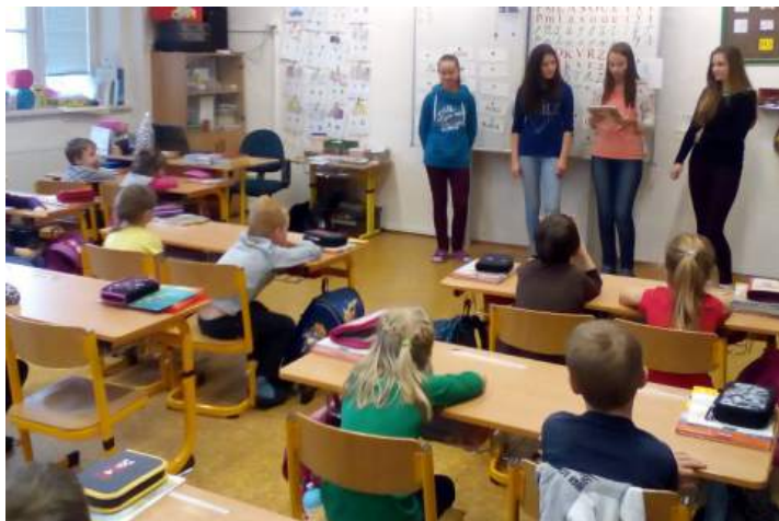
učitelky obou prvních tříd

Na začátku dubna se vydáme prozkoumat i třineckou knihovnu.