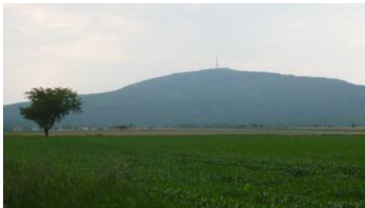
Pohled na Šlězu od východu.

Takové heslo mě inspirovalo k tomu, abych při svém putování po Dolním Slezsku nevynechal i bájnou horu Slezanů – Šlězu. Nachází se asi 30 km na jih od metropole Wrocławu. Auto musíte samozřejmě nechat na parkovišti sedla Tapadla a odtud hodinku ne příliš prudkým, ale trvalým stoupáním na vrchol. Ten se nachází ve výšce 718 m.n.m. Na naše Beskydské poměry se to nezdá moc, ale vzhledem k tomu, že hora jakoby najednou roste