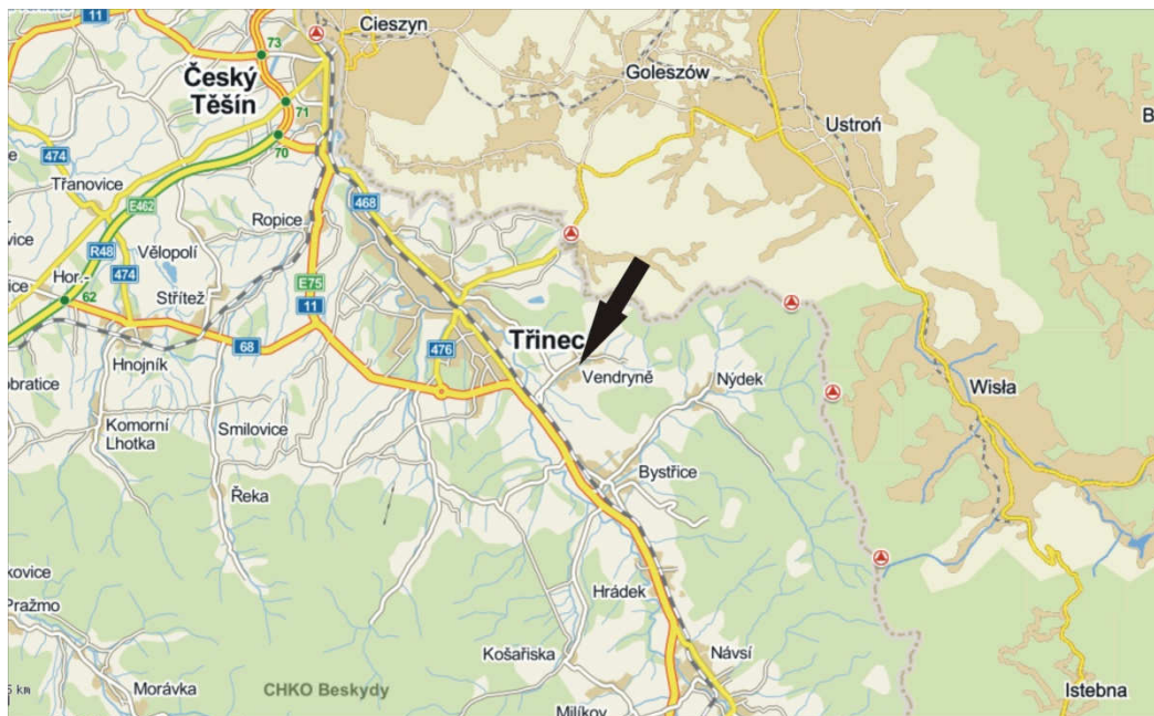
Mapa 1. Širší prostorové vztahy