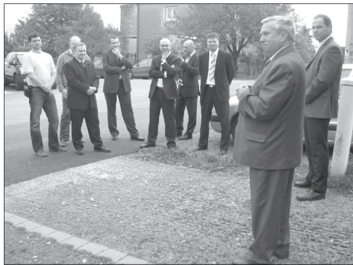
Starosta obce se zástupci firem, které se na realizaci podílely

Knihovna Vendryně srdečně zve na další cestovatelskou přednášku