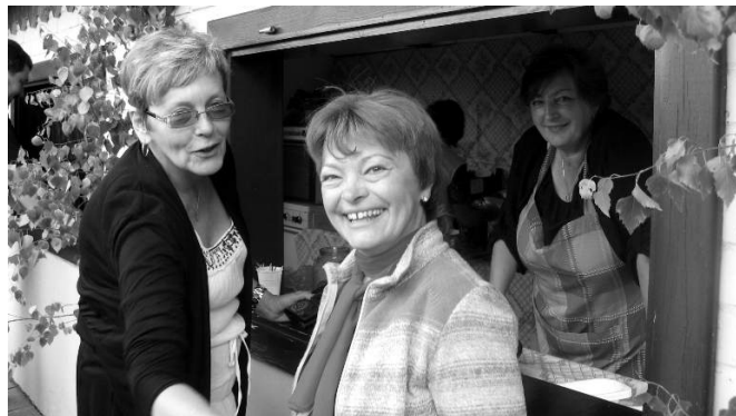
Przybył nie jeden zadowolony gość...