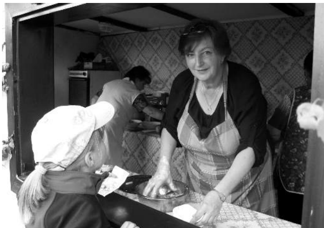
Dzieciom najbardziej smakowały frytki...