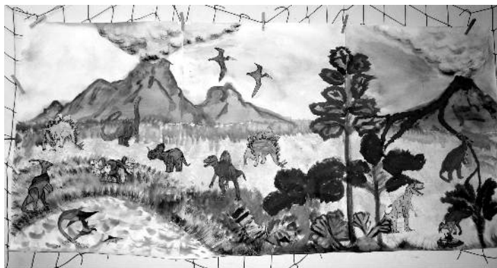
Jedna z licznych prac...