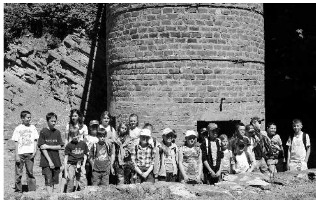
U vendryňských vápenných pecí