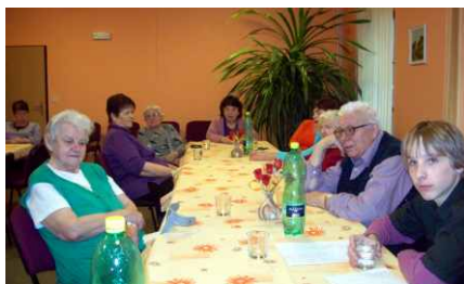
Děti čtou seniorům