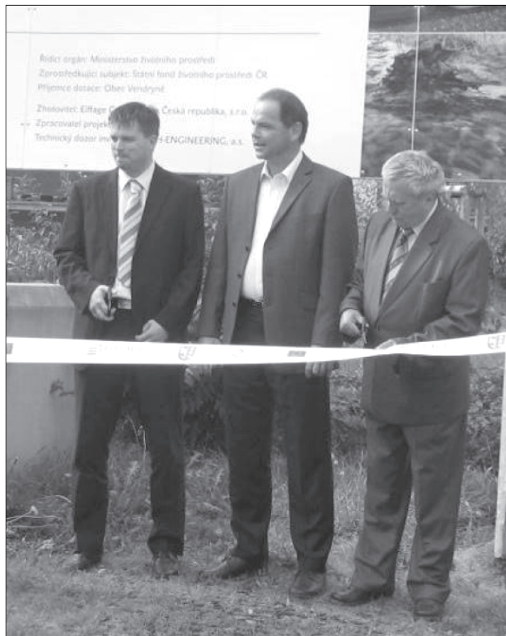
Slavnostní přestřihnutí pásky