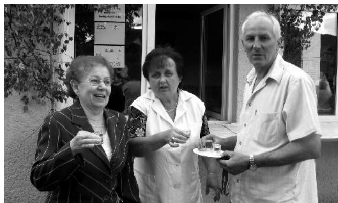
...a dorosłym zaś napoje...