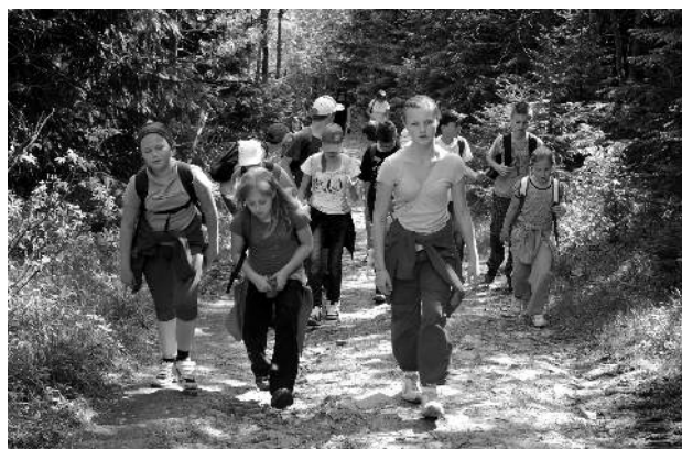
Turistický výlet Javorový – Ostrý – Kozinec